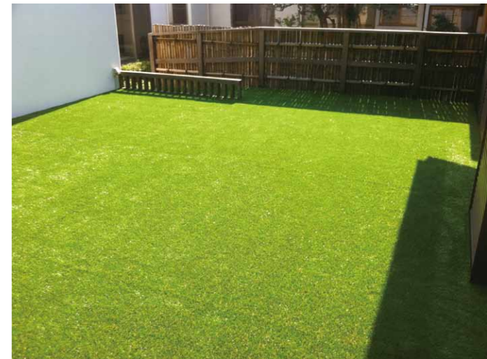
ウッドバルコニー施工例