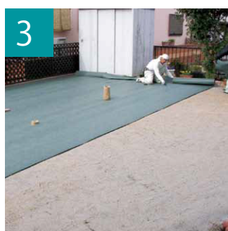
3 隙間なく防草シートを敷き固定します