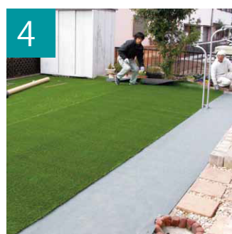
4 丁寧に人工芝を敷いていきます