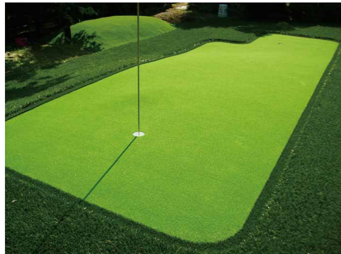
バターグリーン施工例