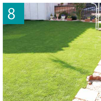
8 仕上がり確認をおこない完成