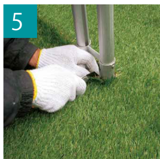
5 ポールなどは目立たないように加工