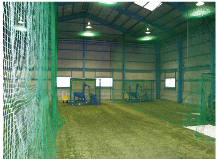
室内練習場施工例