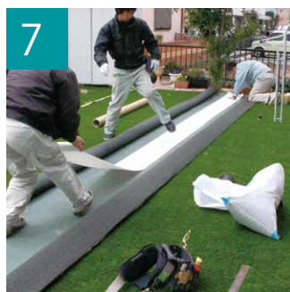
7 人工芝用の接着テープを貼り固定