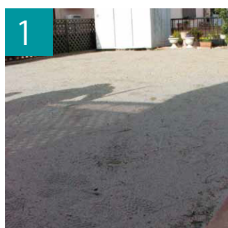
1 草等が生えている場合は抜きます