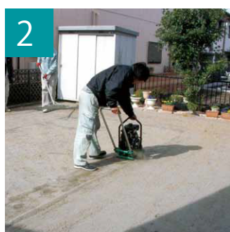
2 機械で土を固め、平らな地盤を作成