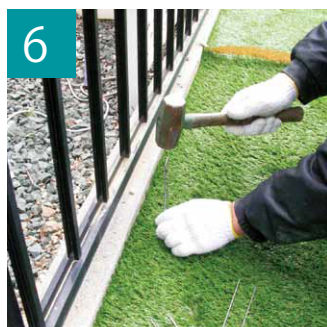
6 U字釘を地面に打って固定